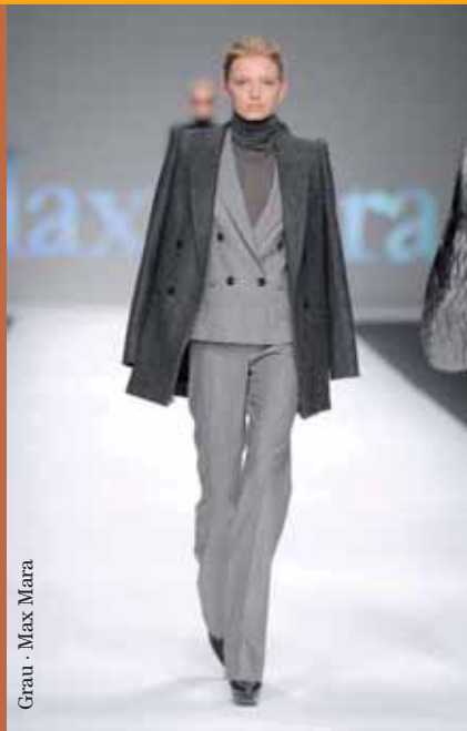
Grau · Max Mara