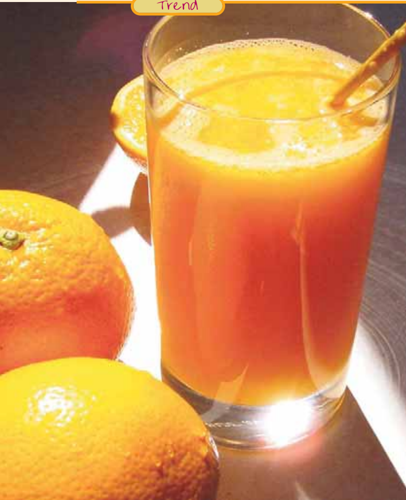
Vitamin C unterstützt den Aufbau von Kollagen, schützt vor freien Radikalen und besitzt bleichende Wirkung.