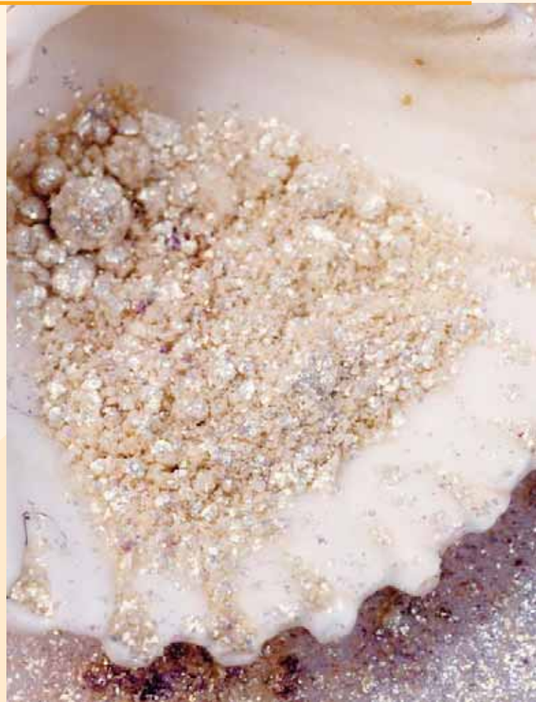
Pearlurin, ein aus Süßwasserperlen gewonnenes Perlenprotein, steigert die Spannkraft der Haut durch seine aktiven Vitalstoffe.

Acid aktiviert die Zellfunktionen der Haut und lässt sie wieder seidig zart erscheinen. Dick aufgetragen kann das Produkt auch als Pflegemaske für Gesicht, Hals und Dekolleté verwendet werden. 15-20 Minuten einwirken lassen. Danach sanft einmassieren. Klopfen Sie mit den flachen Händen mit schnellen Bewegungen über Stirn, Wangen und Kinn. Ebenso belebend wirkt das leichte Zupfen der Wangenpartie. Zum Schluss mit einem Fingerknöchel auf den Mittelpunkt zwischen Nase und Mund drücken.